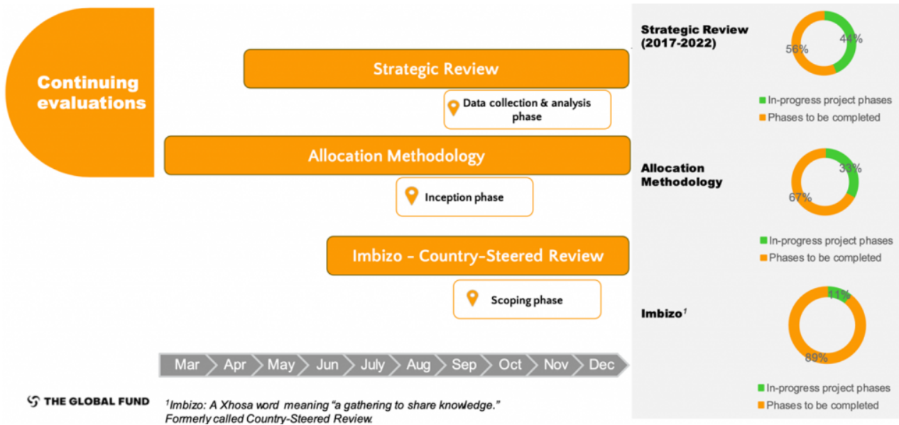
Figure 2. Aperçu de la Revue stratégique 2023 (RS 2023)