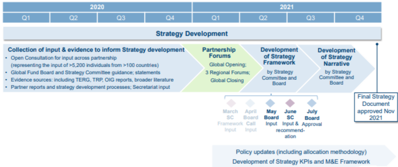
Figure 1 | Chronologie du développement de la stratégie

À la suite de la réunion du comité stratégique en mars, qui a fourni des informations sur un projet de cadre stratégique « version zéro », trois options ont été élaborées pour que le conseil d'administration puisse les commenter lors de sa réunion d'avril (encadré 1 ci-dessous). Chaque option s'appuie sur les mêmes postulats. Toutefois, chacune diffère par la clarté avec laquelle elle hiérarchise les objectifs et par la distinction qu'elle établit entre ce que nous cherchons à réaliser et la manière dont nous devons travailler pour atteindre ces objectifs.