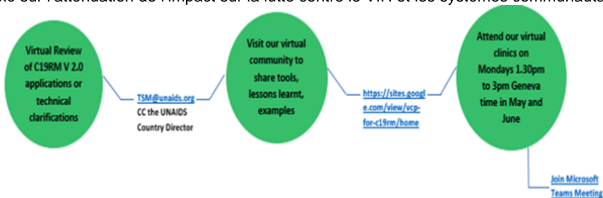
Figure 1. Service d'assistance virtuelle pour les demandes de financement C19RM V 2.0, particulièrement axé sur l'atténuation de l'impact sur la lutte contre le VIH et les systèmes communautaires

Le mécanisme comporte trois éléments : i) examens à distance par les pairs des demandes de financement et éclaircissements techniques (service d'assistance), ii) établissement d'une communauté de pratique et iii) organisation de consultations virtuelles sur des sujets en lien avec l'élaboration des propositions C19RM. La communauté de pratique virtuelle est présentée dans la Figure 2 ci-après ; chaque hexagone autour de la communauté illustre un des nombreux éléments de la candidature pouvant faire l'objet d'une assistance technique.