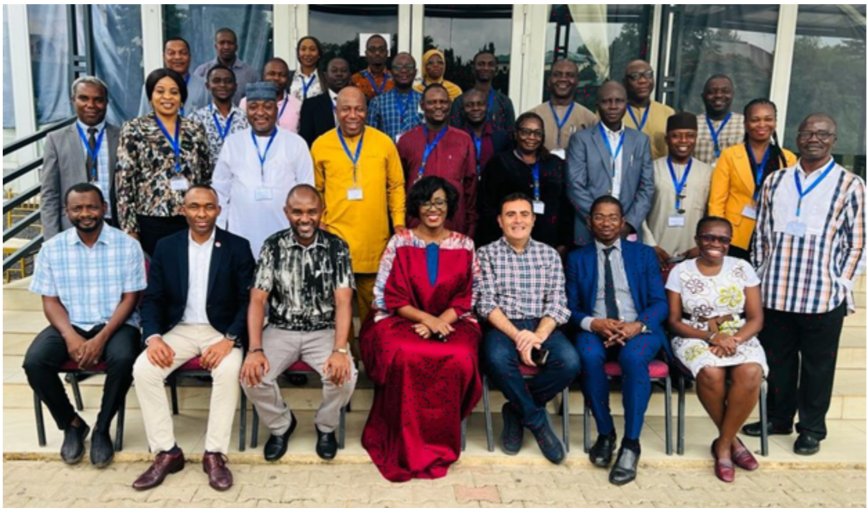
Figure 2: Formation d'Aidsplan-Gavi à l'audit pour l'OAuGF et la NPHCDA à Abuja