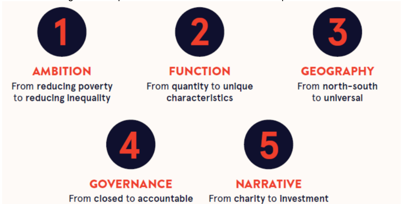
Figure 2. Cinq transformations vers l'investissement public mondial